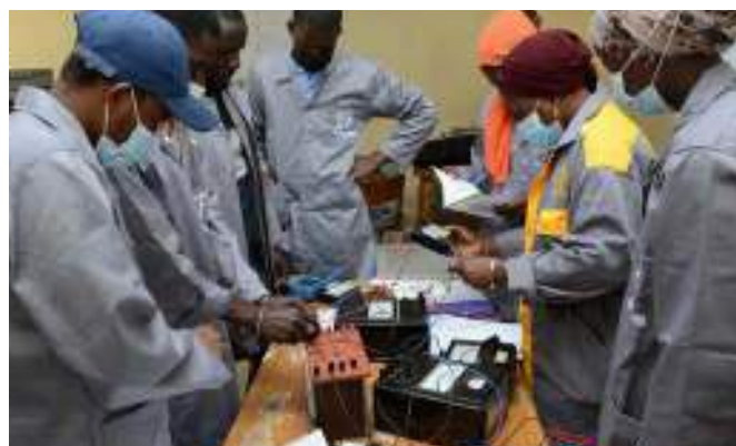
Un groupe d'apprenants en formation en électro-mécanique