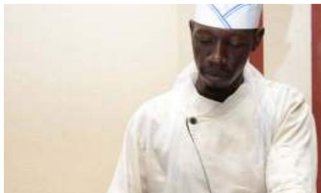
Un apprenant en restauration