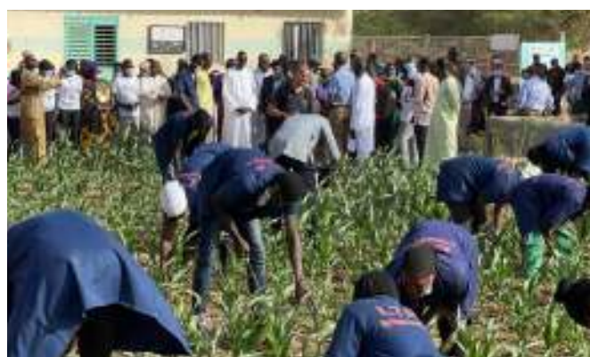
Un groupe d'apprenants en activité dans une ferme agricole