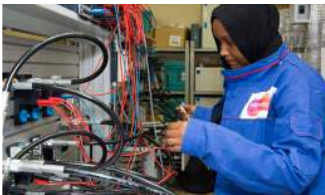
Une apprenante en formation à la Senelec