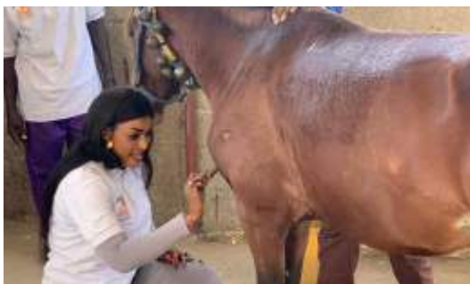
Une apprenante administre des soins à un cheval