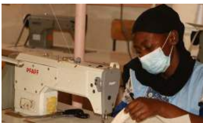
Une apprenante dans un atelier de couture