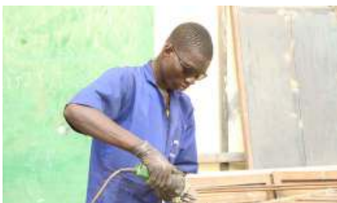
Un apprenant en plein travail avec une meule électrique