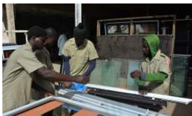
Des apprenants en formation en menuiserie métallique